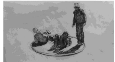
© Le tourniquet – Jan Kopp

Jan Kopp partage comme tous citoyen l'expérience commune de la vie ordinaire, mais, grâce à des formes souvent modestes, il en restitue de manière poétique la beauté naturelle.